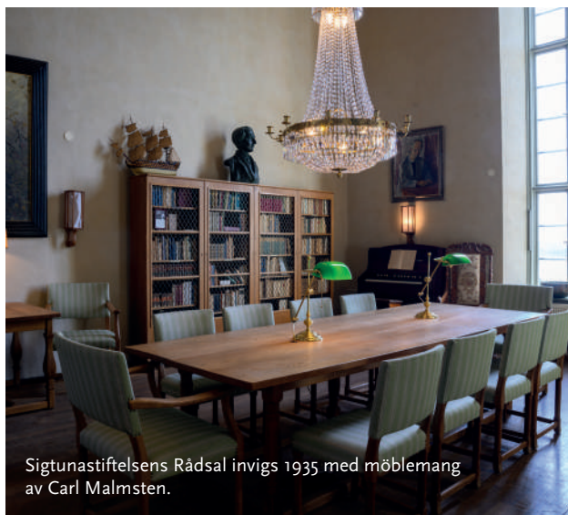
Sigtunastiftelsens Rådsal invigs 1935 med möblemang av Carl Malmsten.