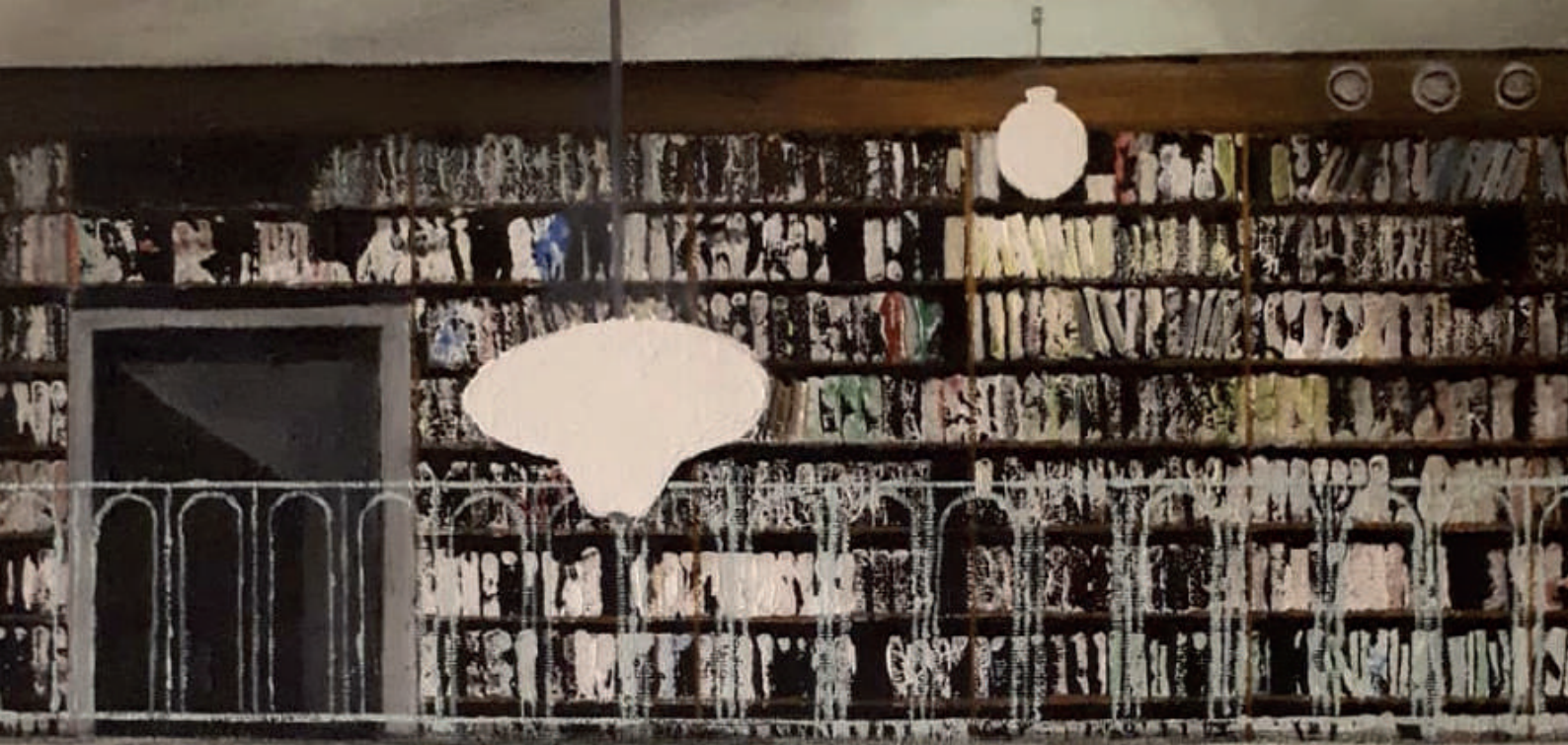
Petter Gabrielssons målning av Sigtunastiftelsens bibliotek ingick i Vårsalongen på Liljevalchs 2021.