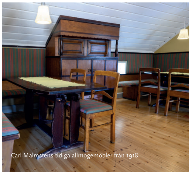
Carl Malmstens tidiga allmogemöbler från 1918.