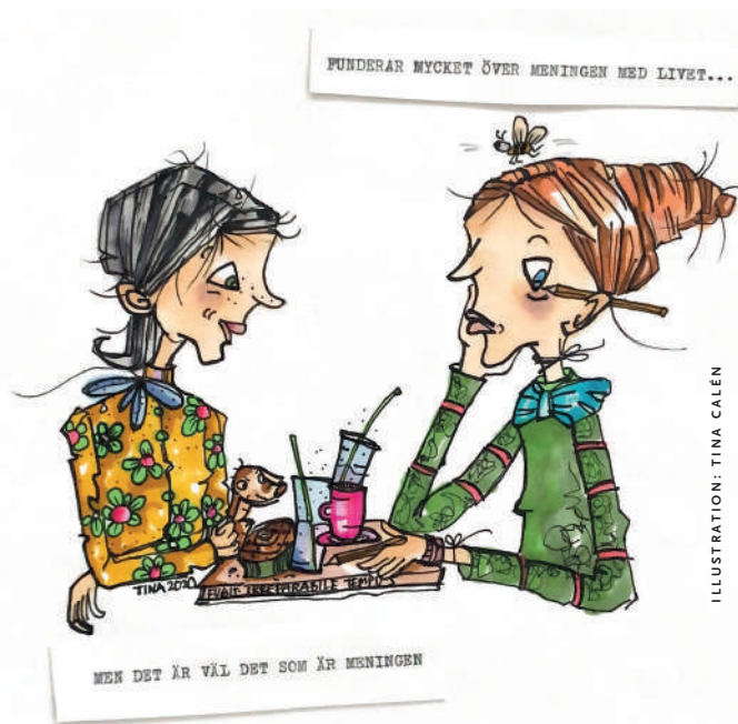
ILLUSTRATION: TINA CALÉN

– Jag försöker skildra det mellanmänniska. Det är nog det som är gemensamt för mina bilder. Och humorn. Även om det kan handla om rätt så allvarliga saker. ●